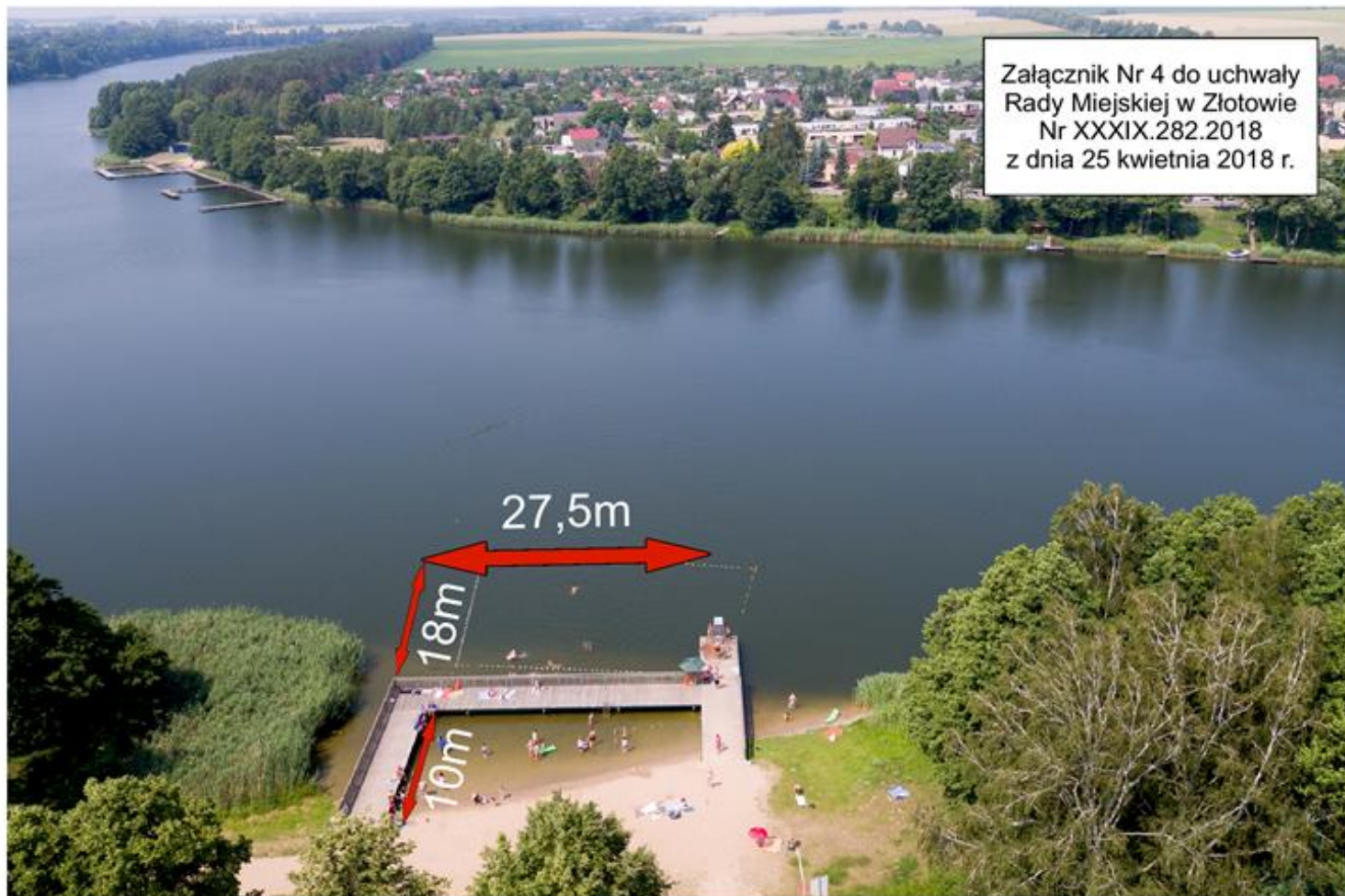
Załącznik Nr 4