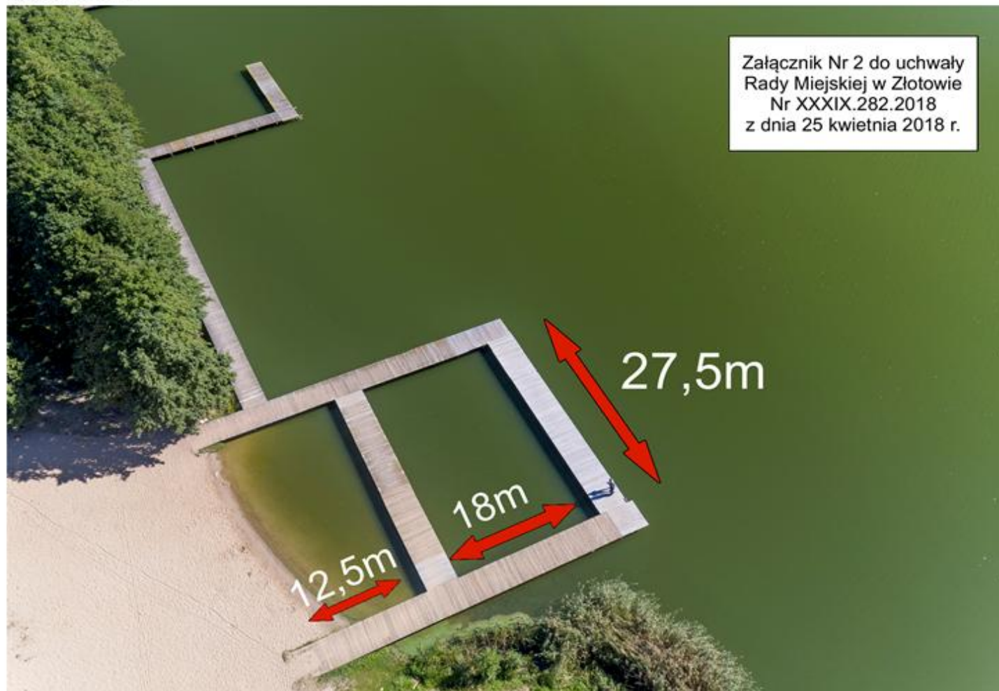
Załącznik Nr 2